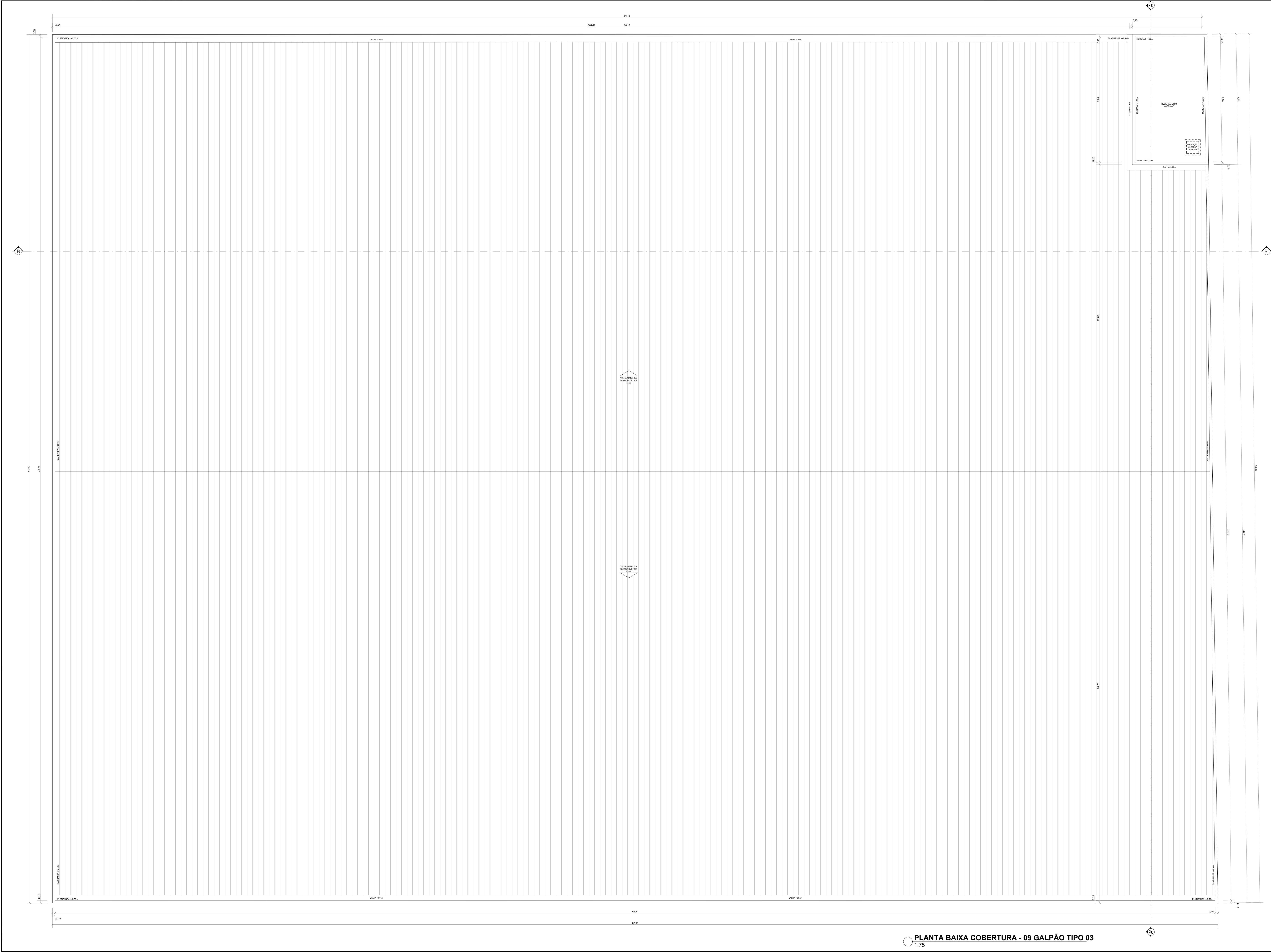
PLANTA BAIXA COBERTURA - 09 GALPÃO TIPO 03