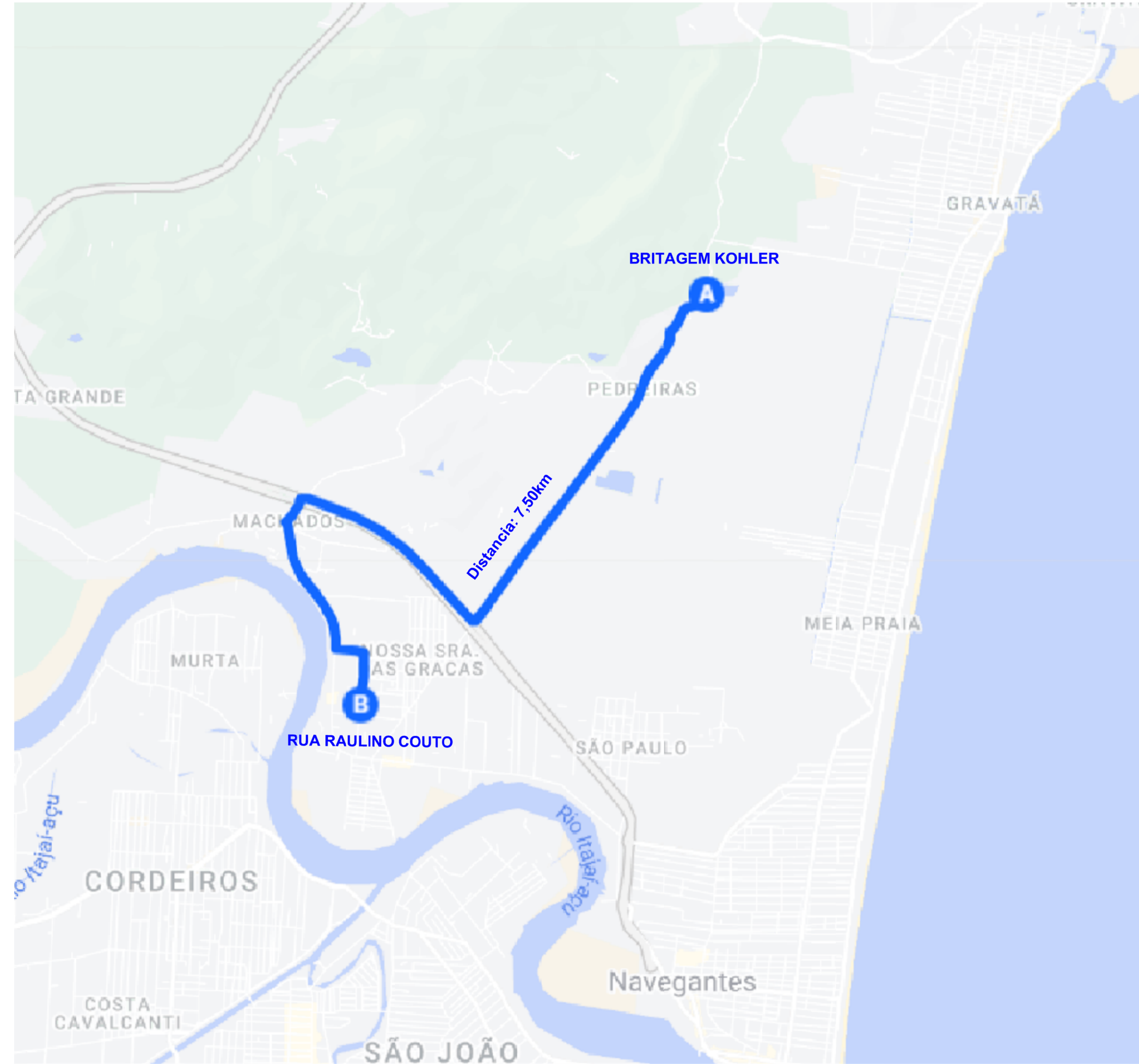
DMT DO MATERIAL BRITADO DISTANCIA: 7,50km