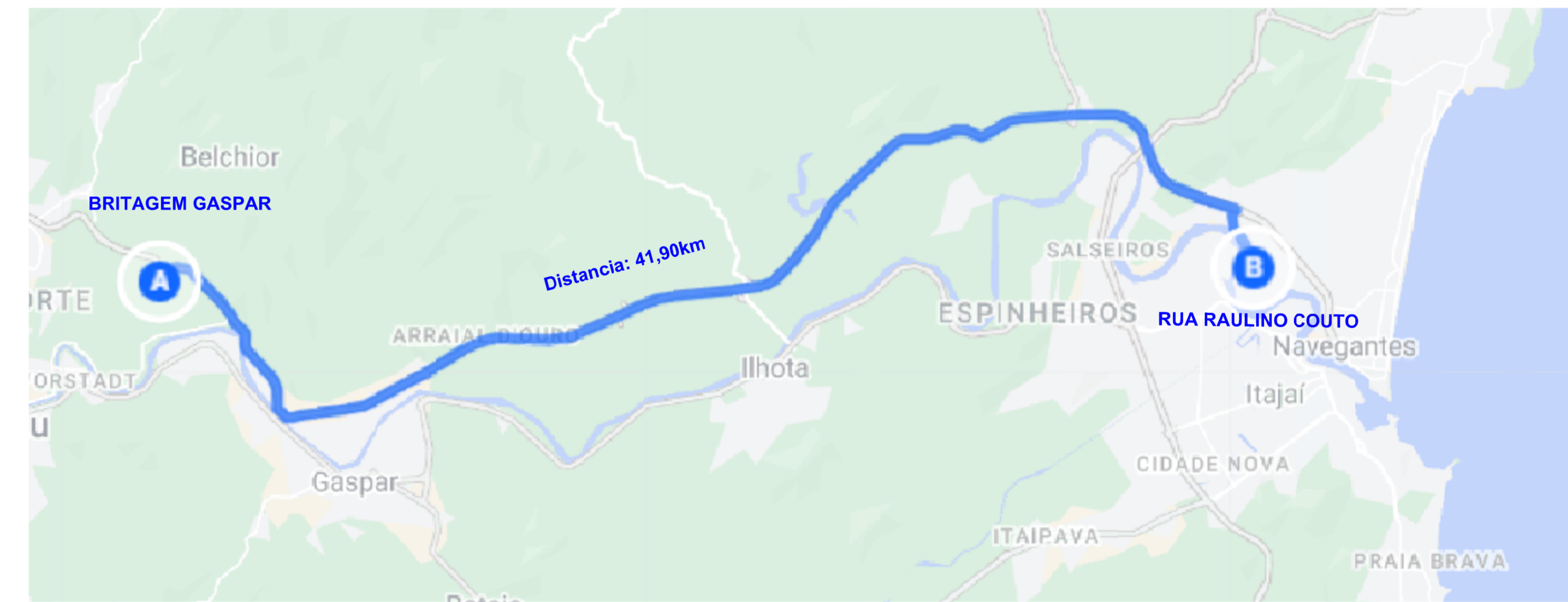
DMT DO MATERIAL ASFÁLTICO DISTANCIA: 41,90km