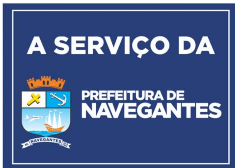
Figura 1 - Dimensões: 30x40 cm

17.3 Identificar os maquinários/veículos/equipamentos com o material padronizado pelo Município de Navegantes/SC;